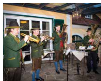
Die Markt-musikkapelle Pischelsdorf am Kulm durfte natürlich nicht fehlen.