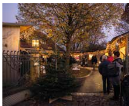
Zahlreiche Verkaufsstände säumten den Zugang zur Kulmländerei.