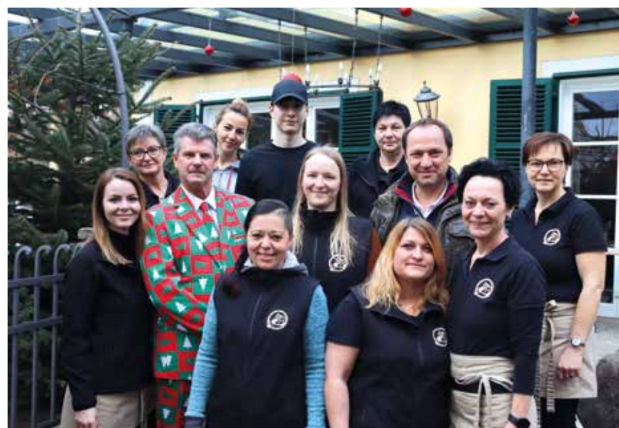
Das Team der Kulmländerei ist beliebt und wurde in der Rubrik „Gastgeber“ bei der Aktion „Köpfe des Jahres“ der Kleinen Zeitung nominiert.

In der Rubrik „Gastgeber“ wurde die Kulmländerei in Pischelsdorf nominiert.