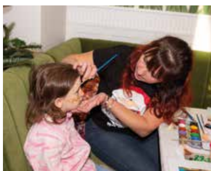
Ein Highlight für Kids war das Kinderprogramm des Elternvereins.