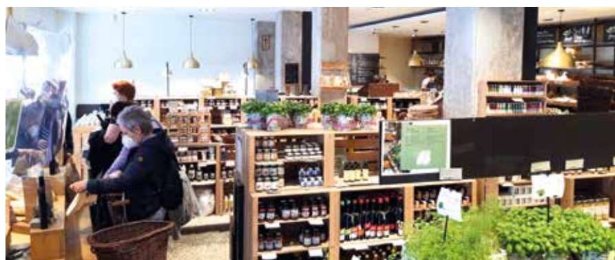
| „Pur Südtirol“ vermarktet regionale Lebensmittel auf höchstem Niveau.

tigung der Bozner Filiale von „Pur Südtirol“ auf dem Programm. Eine perfekte Vermarktung regionaler Qualität mit einer freundlichen und wertigen Präsentation der Produkte zeichnet dieses Unternehmen aus ( pursuedtirol.it ). Eine umfangreiche Vinothek sowie die Kombination aus Lebensmittelverkauf und Gastronomie stehen hier an der Tagesordnung. Besonders interessant: der neue Markt von Pur Südtirol umfasst ein umfangreiches Sortiment unverpackter Waren, um Verpackungsmaterial einzusparen.