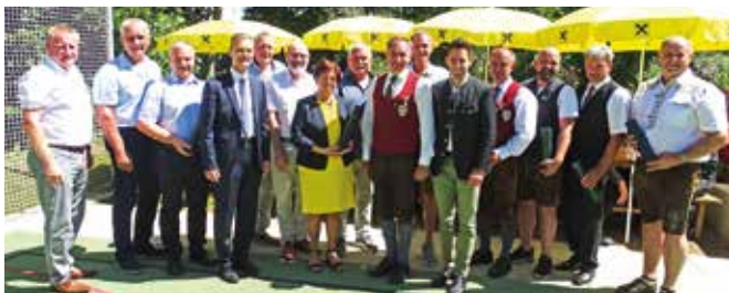
| Eine besondere Ehrung gab es beim Festakt auch für ehemalige Mitglieder des Feistritzaler Gemeinderates.