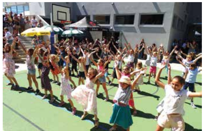
| Begeisterungstürme für die tolle Tanzeinlage der Kinder.